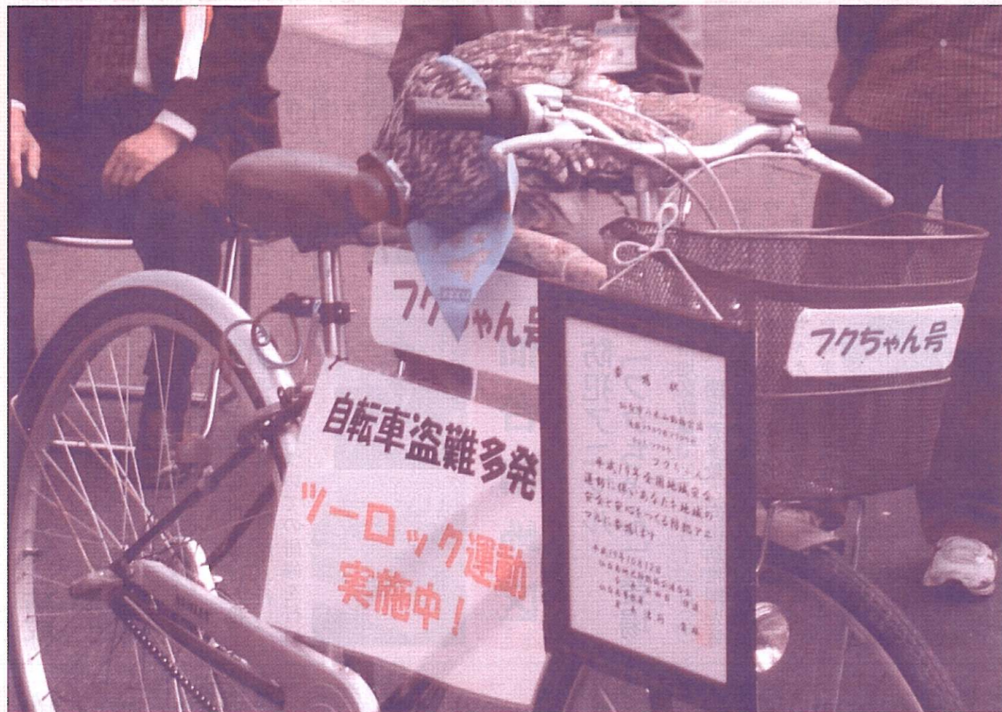
仙台南地区防犯協会連合会