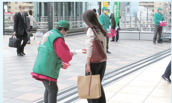
キャンペーンの状況