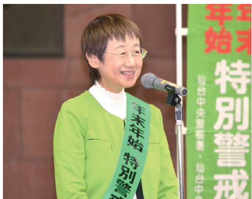
年末年始特別警戒取締りに伴う視察・督励の出発式及び視察の状況