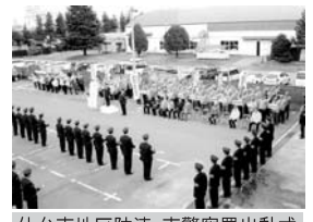
仙台東地区防連・東警察署出動式