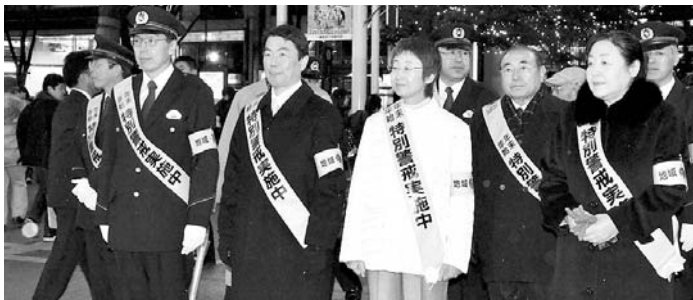
県知事・仙台市長等の繁華街警戒