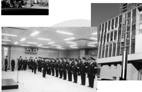
仙台中央地区防連・中央警察署出動式