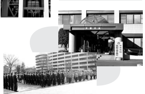
泉地区防連・泉警察署出動式