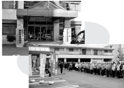
仙台北警察署・北警察署出動式