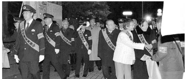
県知事・仙台市長等の繁華街警戒