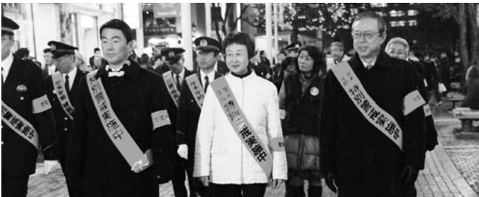
県知事・仙台市長・公安委員長繁華街警戒