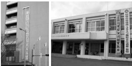
青葉区役所・秋保総合支所

各区役所、各地区防犯協会連合会、各警察署においては、「年末・年始地域安全運動」の懸垂幕を掲出するとともに、出動式を実施して市民の皆様には年末年始の各種犯罪被害防止意識の啓発を図りました。