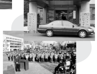
泉地区防連・泉警察署出動式