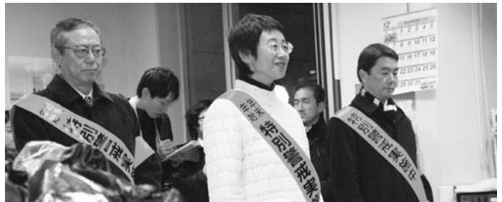
県知事・仙台市長・公安委員長国分町交番激励