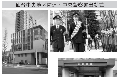
仙台中央地区防連・中央警察署出動式