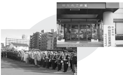
仙台南地区防連・南警察署出動式