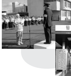
仙台東地区防連・東警察署地区出動式